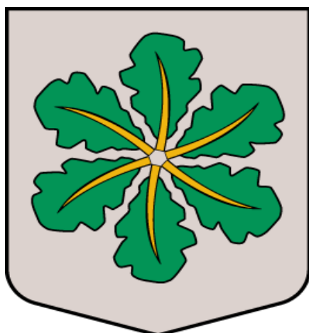
Raiskuma pagasta ģerbonis