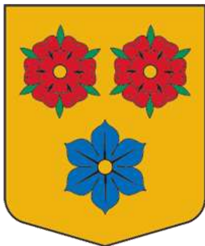
Straupes pagasta ģerbonis